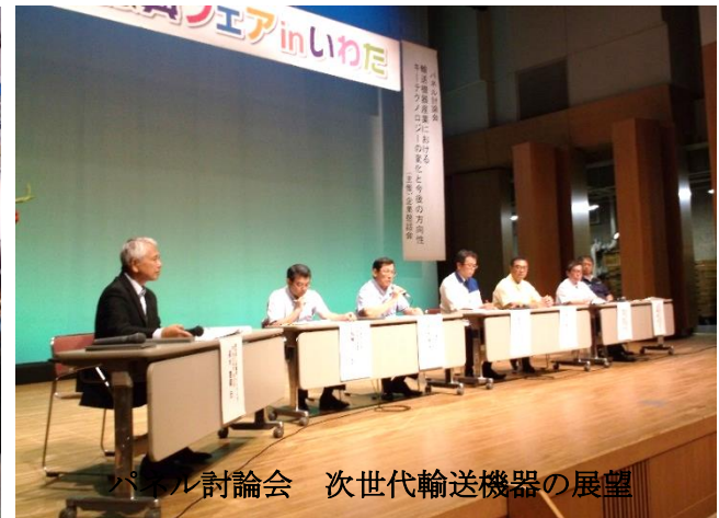
パネル討論会 次世代輸送機器の展望