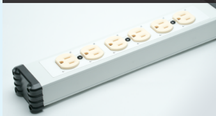
3芯コンセント × 6口