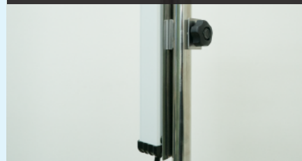
専用金具で IV ポールに取り付けて使用