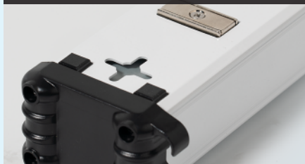
医療施設用プラグ / コンセント仕様