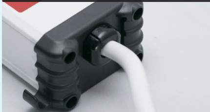
専用金具で IV ポールに取り付けて使用