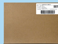
納入形態 (バンド10本入り)