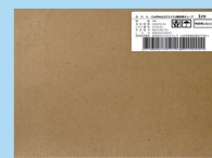
納入形態 (延長チューブ1m 5本入り)