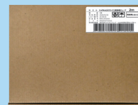
納入形態 (延長チューブ2m 5本入り)